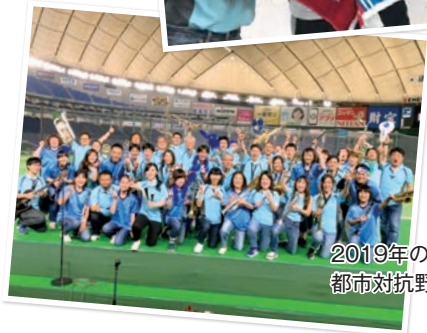
2019年の都市対抗野球大会にて