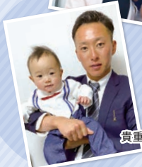
貴重なスーツ姿での1枚